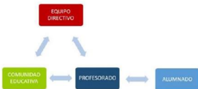
DIAGRAMA DE FLUJO DE INTERACCIÓN, COLABORACIÓN Y COMUNICACIÓN DE LA COMUNIDAD EDUCATIVA A TRAVÉS DE LA PLATAFORMA