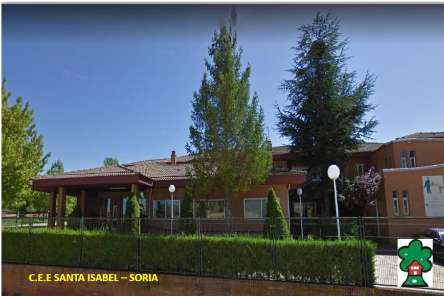
C.E.E SANTA ISABEL – SORIA