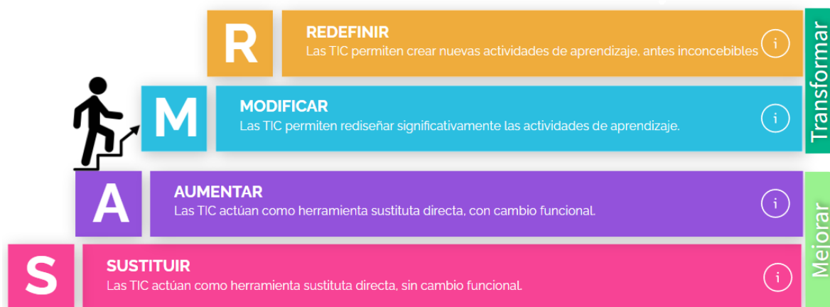
Ilustración 1: Infografía de Rubén Puentedura publicada con licencia CC BY-NC-SA. Disponible en https://view.genial.ly/61a9349e6288510d77b1eca2/guide-modelo-samr [fecha de consulta 22/04/2022]