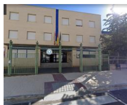
ACCESO 1/ TRIBUNAL 2 C/ Alonso Velázquez s/n (puerta central/girar a la derecha según se entra, por el patio) ACCESO 2 / TRIBUNAL 3 Y 4 C/ Alonso Velázquez s/n (puerta central/seguir de frente según se entra, por la puerta principal del edificio)