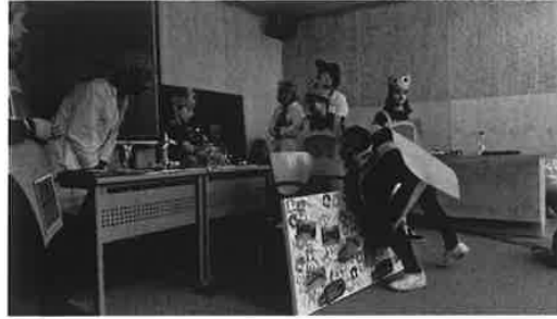
Pensamiento Computacional a través de Smile&Learn