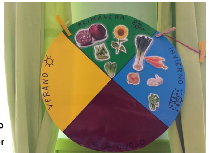
Letreros para el huerto, prep siembra meses, glosario, ser