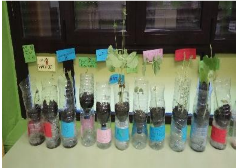
Germinando alubias, garbanzos y lentejas.