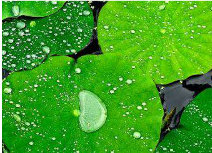
Figura 2. Hoja de loto

Se llama así por las hojas de loto, cuya superficie es superhidrofóbica (superficie que repele fuertemente el agua).