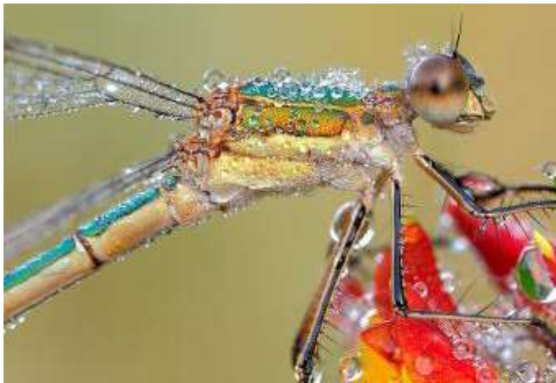
Figura 5. Libélula

Este tipo de superficies también se encuentran en la naturaleza en los insectos y algunos otros animales. Sus propiedades son ideales como medio de protección contra el agua, pero también tienen otras aplicaciones más específicas.