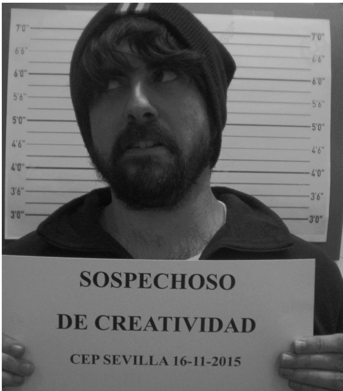
Ilustración 4: Sospechoso de creatividad. CEP de Sevilla

Las sesiones temáticas son ideales para trabajar en momentos puntuales, por ejemplo, inicio de trimestre o celebración de efemérides. Se trata de dotar a la sesión de un marco, de un hilo conductor, de dirigir los distintos ejercicios a la consecución de un objetivo. Así ocurrió en las Jornadas de Polígono Sur, en las que preparé una batería de ejercicios cuya realización facilitaba la consecución de distintas pistas encaminadas a descubrir qué había pasado con un cadáver encontrado en el edificio. Pensemos... ¿Cómo podría motivar a los profesores a entrar en mi taller?