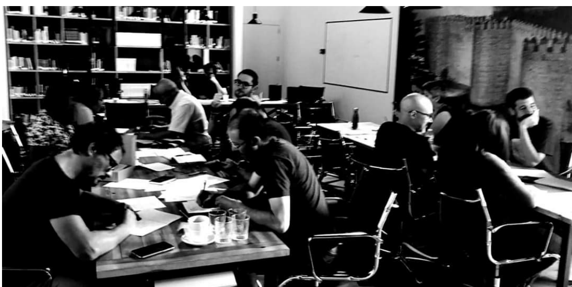
Ilustración 3: Taller de apropiacionismo. Ávila.

En cada una de las sesiones de un curso, o en la celebración puntual de un taller, cobra especial relevancia lo inesperado. Independientemente de la destreza que se pretenda desarrollar siempre se apoya en otras. De ahí que un taller de escritura creativa para docentes no pueda ir desligado de otras acciones tan necesarias como la expresión oral, la improvisación, la acción performativa, o el propio cuerpo. En el fondo, lo que se impone es la acción conjunta en el ámbito de la competencia comunicativa.