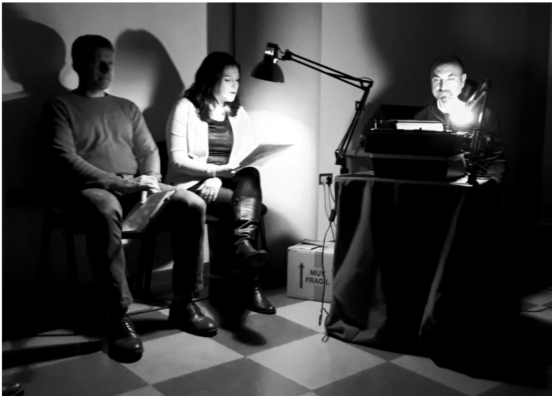
Ilustración 1: Lectura performatizada. CPR Mérida

Ya en este momento comenzaron algunas de mis sospechas: los profesores, como los alumnos, necesitan expresarse, reunirse, comunicarse entre iguales; también pensé en los ponentes y en la necesidad de que conozcan la realidad educativa aparte de ser especialistas en algo.