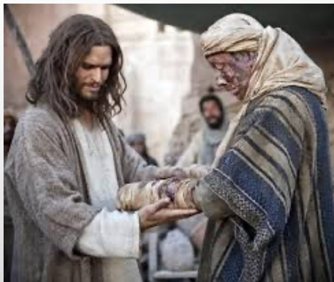
CURACIÓN DE UN LEPROSO (Lc 5,12-16)

Si en algún momento los leprosos se acercaban a algún sitio poblado, eran obligados a hacer sonar una campanilla para advertir de su presencia.