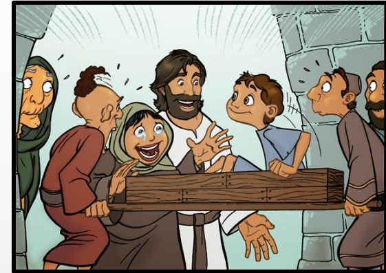
RESURRECCIÓN DEL HIJO DE LA VIUDA DE NAÍN (Lc 7,11-17)