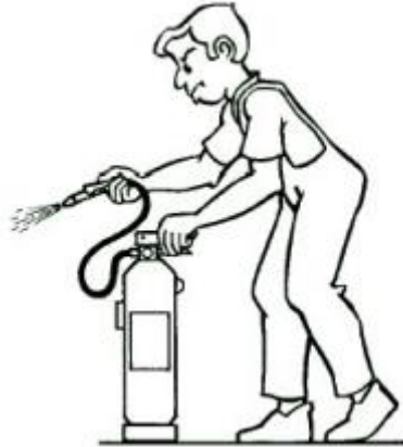
Imagen 3: Presionar palanca

Presionar la palanca de la cabeza del extintor y en caso de que exista apretar la palanca de la boquilla realizando una pequeña descarga de comprobación. (Imagen 3)