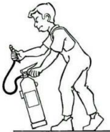
Imagen 2: Asir la boquilla de la manguera

Asir la boquilla de la manguera del extintor y comprobar, en caso que exista, que la válvula o disco de seguridad está en posición sin riesgo para el usuario. Sacar el pasador de seguridad tirando de su anilla. (Imagen 2)