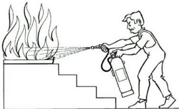
Imagen 4: Dirigir chorro a base de las llamas

Dirigir el chorro a la base de las llamas con movimiento de barrido. En caso de incendio de líquidos proyectar superficialmente el agente extintor efectuando un barrido evitando que la propia presión de impulsión provoque derrame del líquido incendiado. Aproximarse lentamente al fuego hasta un máximo aproximado de un metro. (Imagen 4)