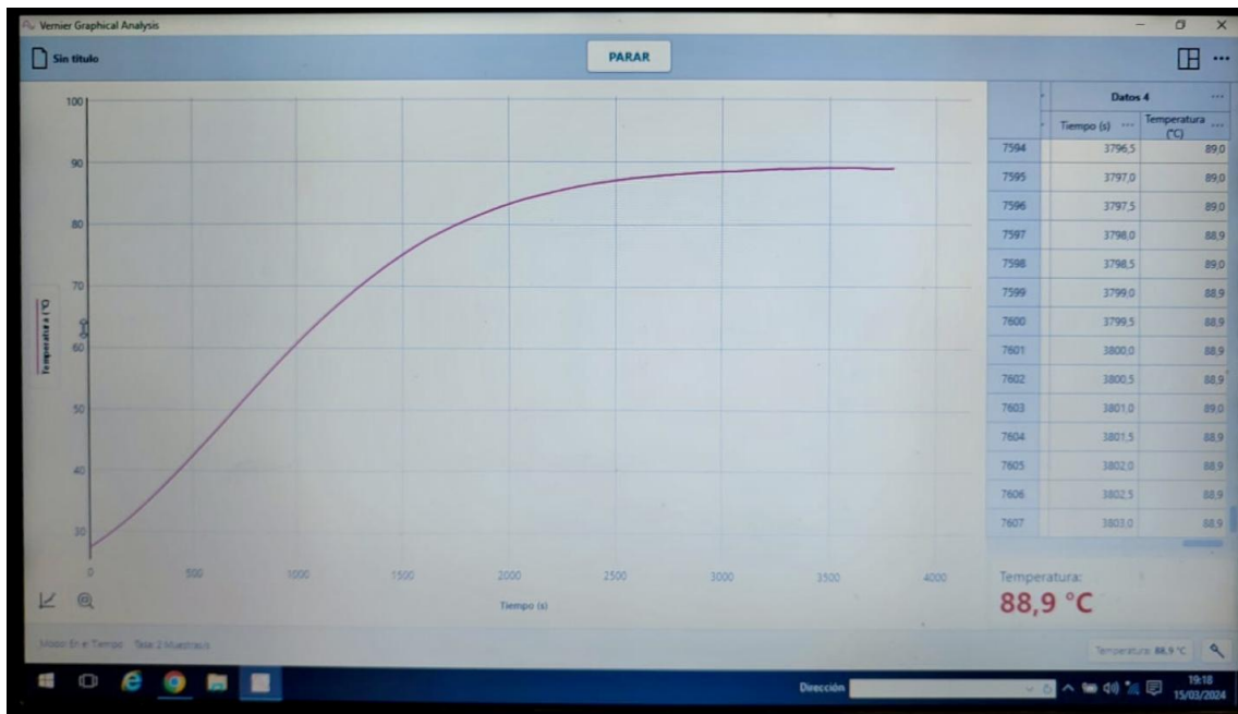
(Al final del calentamiento)