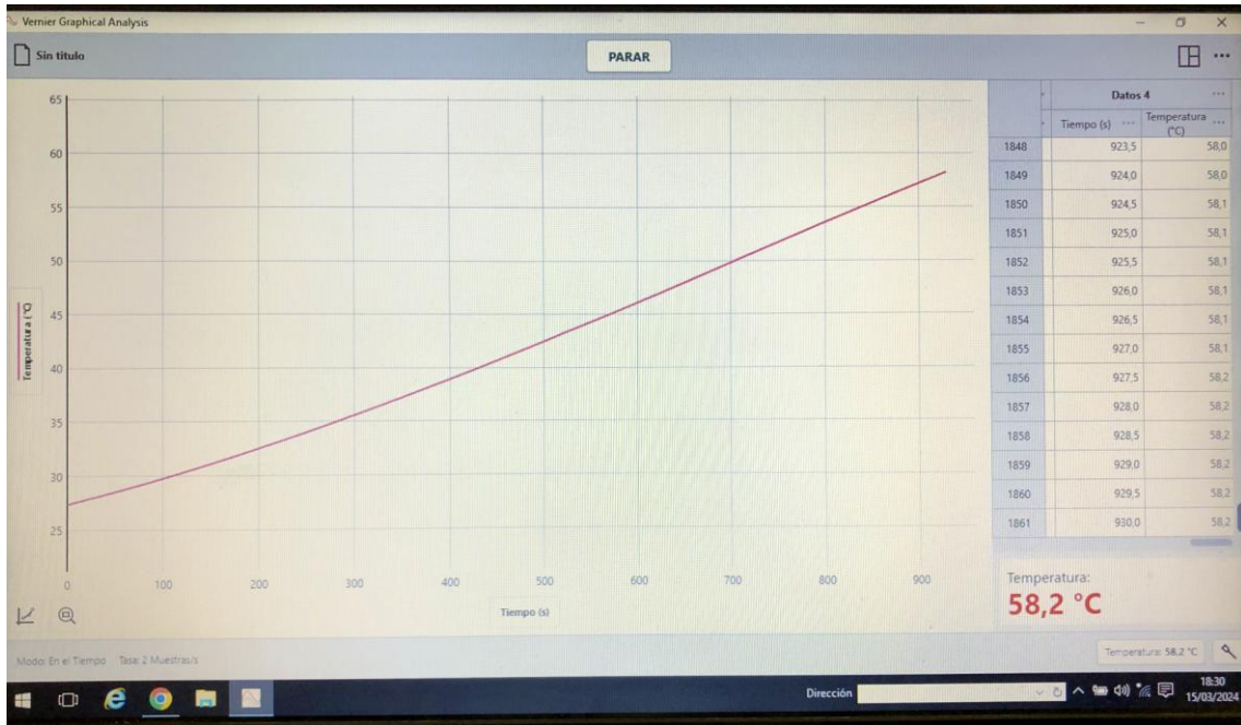
(Al principio del calentamiento)

Debemos comprobar que la gráfica obtenida es similar a la de las figuras: