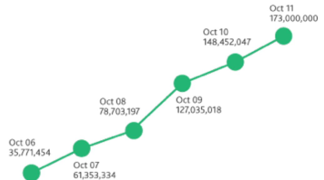
Number of Blogs Tracked by NM Incite

Read as: In October 2011 NM Incite tracked 173 million blogs as sources of online buzz.