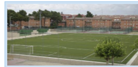
Campo de fútbol de Arévalo