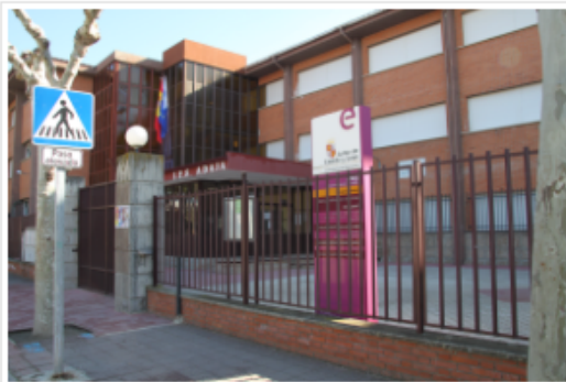
Campo de fútbol de Arévalo.

Me gusta 99 Compartir Tweet G+1 0 Compartir 1