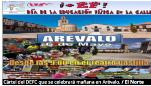
Cartel del DEFC que se celebrará mañana en Arévalo.

FERNANDO G. MURIEL | Me gusta 20 | 5 mayo 2016 19:18