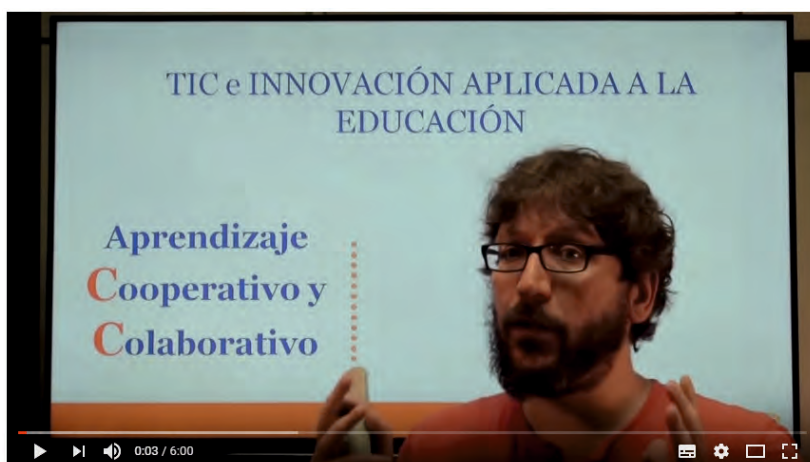
Diferencias entre el aprendizaje cooperativo y el aprendizaje colaborativo. TIC e Innovación