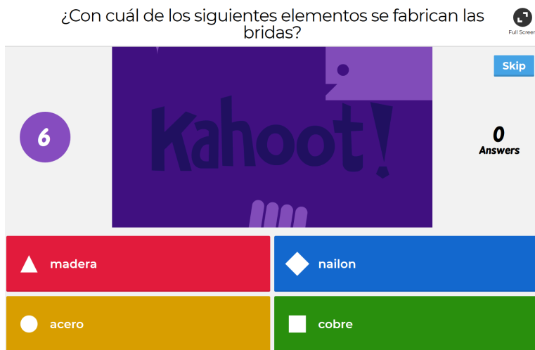
Figura 1: Interfaz de preguntas de Kahoot! proyectada.

La dinámica de juego de Kahoot! es que el profesor lanza en un proyector un cuestionario previamente diseñado sobre un tema o varios. Las preguntas del cuestionario son proyectadas para que los alumnos puedan leerlas tal y como se muestra en la figura 1. Los alumnos las van respondiendo utilizando para ello sus teléfonos inteligentes o los ordenadores del aula con una interfaz como la que se muestra en la figura 2.