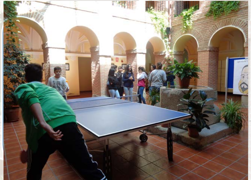
Actividades y tratamiento de los alumnos con necesidades educativas especiales