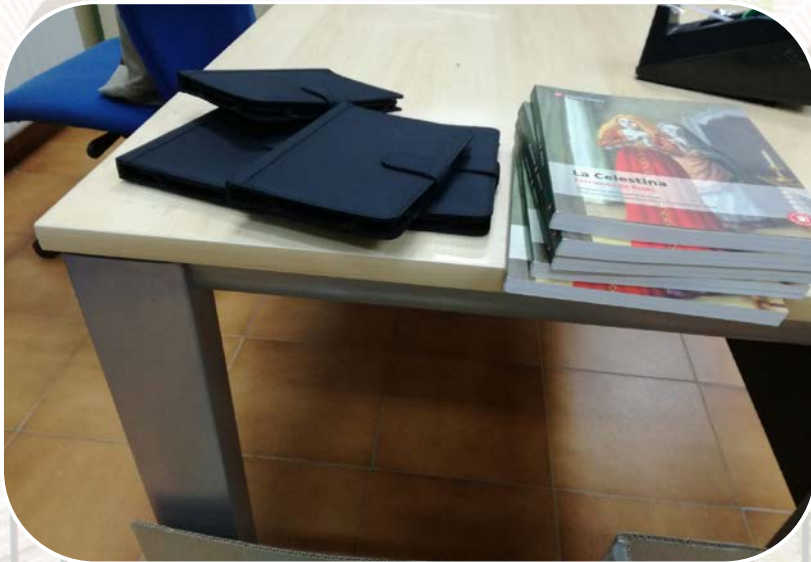
Integración didáctica de las TIC