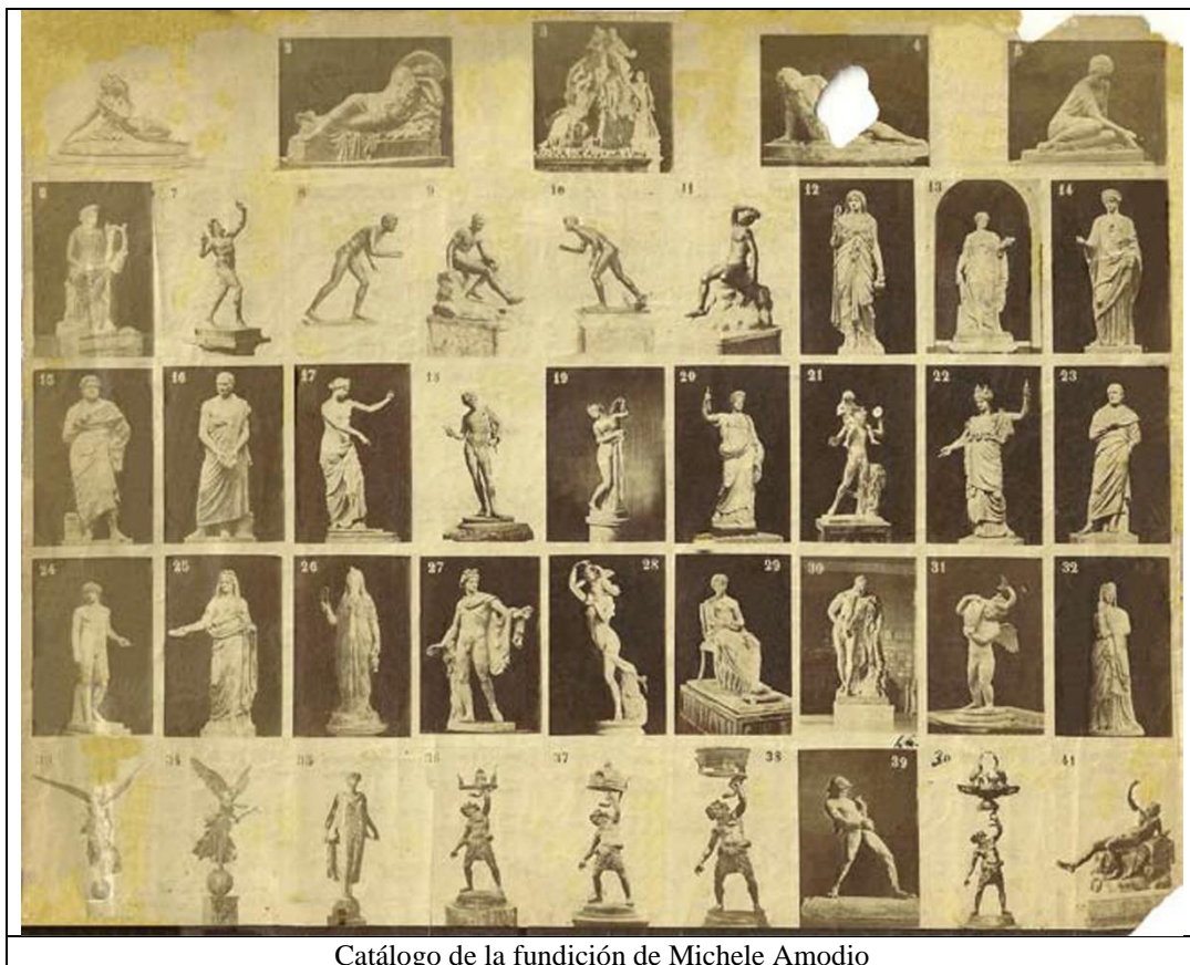
Catálogo de la fundición de Michele Amodio

un primer momento su producción fue orientada hacia la temática del Golfo de Nápoles, con sus paisajes, con el Vesubio y sus erupciones, con escenas costumbristas y de vida cotidiana; en un segundo momento, su interés pasó a centrarse en las excavaciones de Pompeya, en los restos arqueológicos que se iban descubriendo y, al final, las importantes esculturas que se iban desenterrando en los yacimientos. El gabinete fotográfico de los hermanos Amodio, pues, producía y vendía fotografías de todo lo que hemos hablado para los turistas adinerados que visitaban Nápoles; de este modo los turistas podían llevarse a casa un recuerdo de lo que habían visitado. Entre los productos estrella del taller de los hermanos Amodio cabe señalar la venta de pares estereoscópicos, para que los turistas, mediante un visor especial, pudieron ver en tres dimensiones los lugares y monumentos que habían visitado una vez regresados a casa.