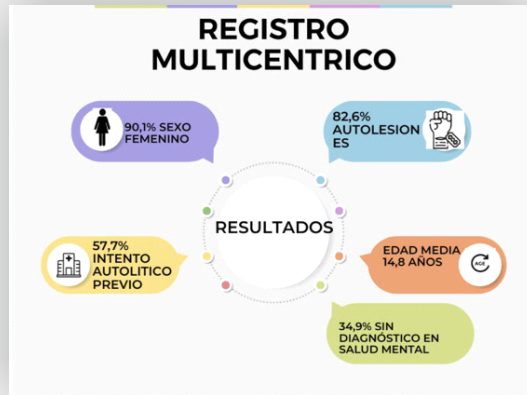
Figura sobre autolesiones tomada de Vázquez López y cols., 2023:

Ahora bien, los estudios parecen indicar que en población pediátrica se observa un incremento de casi un 50% en el número de visitas a Urgencias por motivos de consulta relacionados con salud mental tras el periodo de confinamiento (Merino-Hernández y cols., 2023). Es más, «[l]as conductas suicidas, las autolesiones y los fallecimientos por suicidio están aumentando de forma alarmante en niños y adolescentes en nuestro entorno, en especial tras la pandemia por COVID-19» (Vázquez López y cols., 2023).