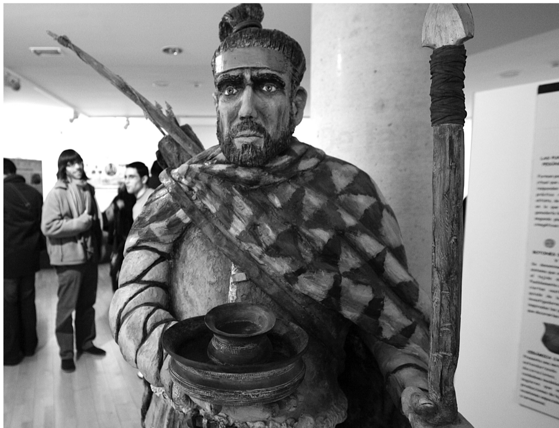
Escultura de un guerrero de la época campaniforme en la exposición del Gaya Nuño. CONCHA ORTEGA