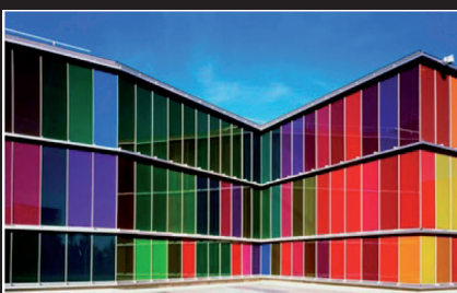
MUSEO DE ARTE CONTEMPORÁNEO DE CASTILLA Y LEÓN. MUSAC (LEÓN)