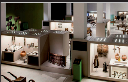
MUSEO ETNOGRÁFICO DE CASTILLA Y LEÓN (ZAMORA)