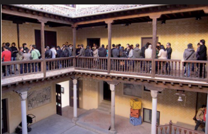
PALACIO DE QUINTANAR, CENTRO DE INNOVACIÓN Y DISEÑO (SEGOVIA)