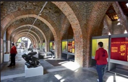
MUSEO DE LA SIDERURGIA Y LA MINERÍA (SABERO, LEÓN)