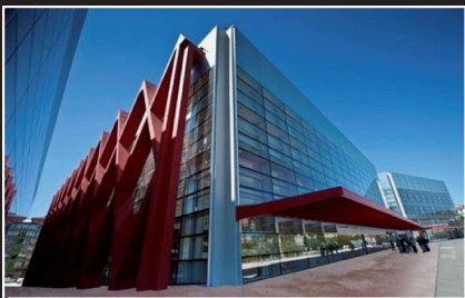
MUSEO DE LA EVOLUCIÓN HUMANA (BURGOS)